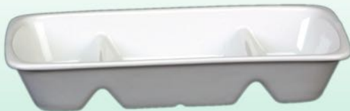
Schale 1631 76 H 33 x B 200 x 100 mm Inhalt 0,15 l, VE 36/6 St.