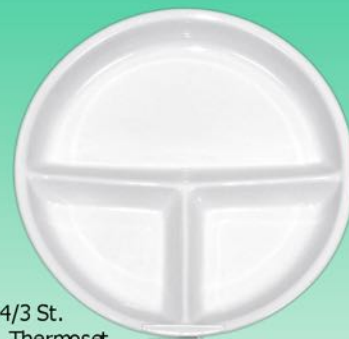
Platte 03 25,5 cm, VE 24/3 St. u.a. für Royal, Thermoset