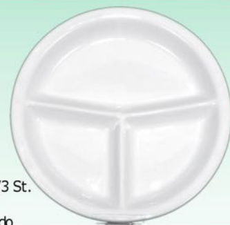
Platte 04 25,5 cm, VE 24/3 St. u.a. für Hepp, Combitray, Rondo