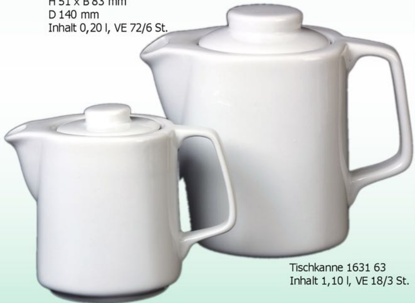
Tischkanne 1631 63 Inhalt 1,10 l, VE 18/3 St.