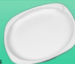
Platte 1631 74 24,9 cm, VE 24/6 St. u.a. für Caldomet, Caldotray