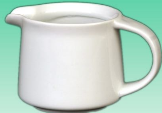
Systemkanne 1631 53 Inhalt 0,37 l, VE 24/6 St.