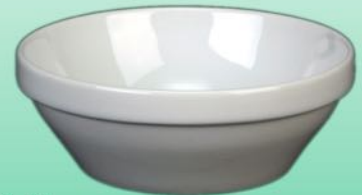
Schale 1631 12 H 52 x B 140 mm Inhalt 0,47 l, VE 48/6 St.