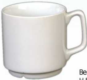
Becher AH 025 H 80 X B 78 mm Inhalt 0,25 l, VE 48/12 St.