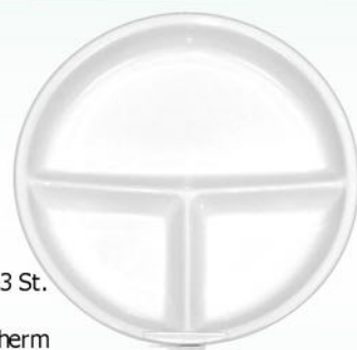
Platte 03 II 25,5 cm, VE 24/3 St. für Variotherm, Internet, Intertherm