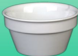
Schale 1631 70 H 60 x B 120 mm Inhalt 0,40 l, VE 48/6 St.