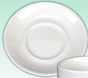
Kombi Untere 1631 02U D 140 mm VE 72/6 St.