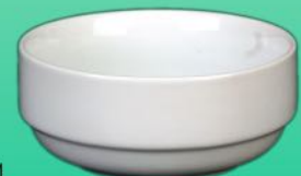
Schale 1631 11 H 50 x B 120 mm Inhalt 0,40 l, VE 48/6 St.