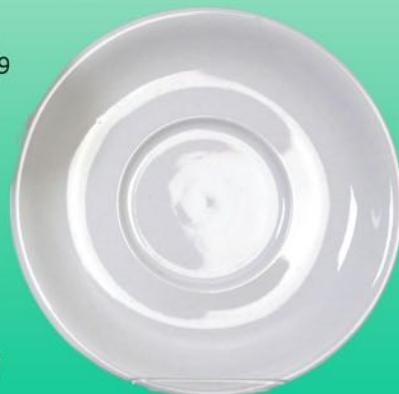
Becher Untere 2132 UA D 155 mm, u.a. für AH 022, AH 025, AH 029 VE 48/6 St.