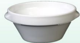
Suppenschale 1631 B4 H 57 x B 119 mm Inhalt 0,35 l, VE 48/6 St.