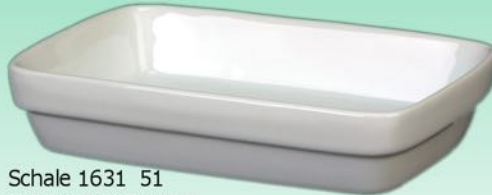
Schale 1631 51 H 34 x B 110 x 175 diag. 192 mm Inhalt 0,33 l, VE 24/6 St.