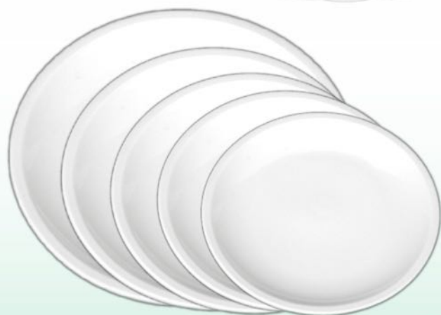
Coupteller Katja flach 19 cm, VE 48/6 St. flach 21 cm, VE 48/6 St. flach 24 cm, VE 24/6 St. flach 26 cm, VE 24/6 St. flach 29 cm, VE 12/6 St. tief 21 cm, VE 24/6 St. tief 26 cm, VE 24/6 St.