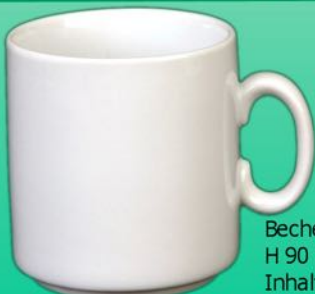
Becher AH 029 AR H 90 X B 81 mm Inhalt 0,29 l, VE 48/12 St.