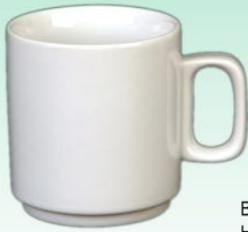
Becher AH 022 BH H 82 x B 75 mm Inhalt 0,22 l, VE 48/6 St.