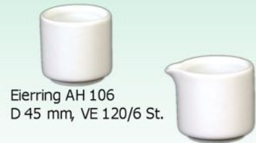
Eierring AH 106 D 45 mm, VE 120/6 St.