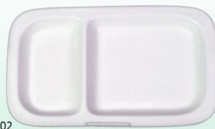
Platte 02 28,5 x 17,0 cm, VE 24/6 St.