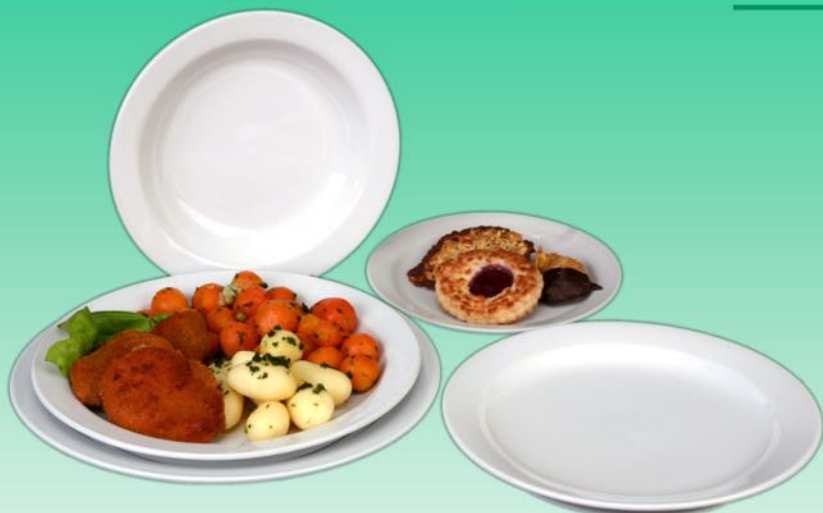
Fahnenteller Karina flach 19 cm, VE 48/6 St. flach 21 cm, VE 48/6 St. flach 24 cm, VE 24/6 St. flach 26 cm, VE 24/6 St. flach 28 cm, VE 24/6 St. tief 21 cm, VE 24/6 St.