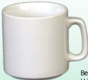
Becher 1631 09 H 77 X B 79 mm Inhalt 0,26 l, VE 48/6 St.