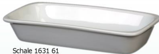
Schale 1631 61 H 33 x B 200 x 100 Inhalt 0,40 l, VE 48/6 St.