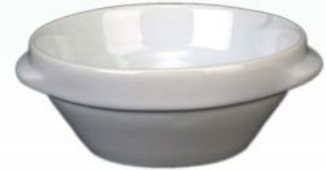
Suppenschale 1631 B1 H 56 x B 130 mm Inhalt 0,40 l, VE 48/6 St.