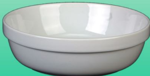
Eintopf 1631 16 H 58 x B 194 mm Inhalt 1,1 l, VE 24/6 St.