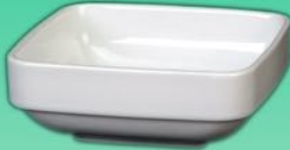
Schale 1631 13 H 42 x B 115 x 115 diag. 150 mm Inhalt 0,31 l, VE 48/6 St.