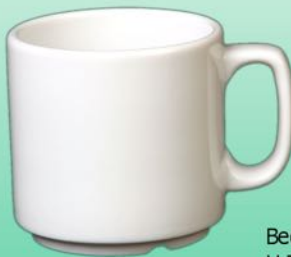
Becher AH 026 AR H 72 X B 81 mm Inhalt 0,27 l, VE 48/12 St.