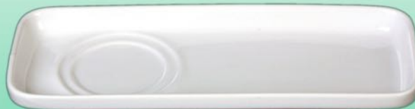
Setplatte 1631 58 L 235 x B 92 x H 22 mm u.a. für 1631 01, 1631 09 VE 48/6 St.