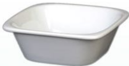
Schale 1631 77 H 33 x B 100 x 100 mm Inhalt 0,19 l, VE 48/6 St.