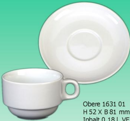
Obere 1631 01 H 52 X B 81 mm Inhalt 0,18 l, VE 72/6 St.