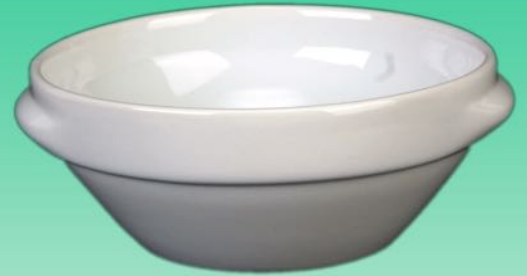
Suppenschale 1631 B2 H 70 x B 185 mm Inhalt 0,90 l, VE 16/4 St.