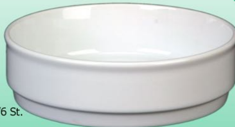
Eintopf 1631 17 H 52 x B 175 mm Inhalt 0,90 l, VE 24/6 St.