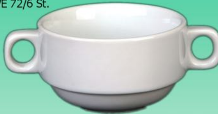
Suppen Obere 1631 10 H 50 X B 93 mm Inhalt 0,25 l, VE 72/6 St.