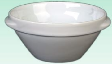
Suppenschale 1631 B3 H 66 x B 151 mm Inhalt 0,50 l, VE 48/6 St.