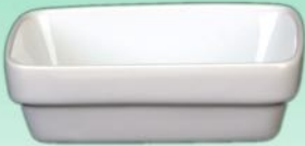
Schale 1631 50 H 34 x B 84 x 111 diag. 130 mm Inhalt 0,17 l, VE 48/6 St.