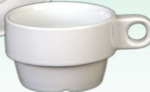
Obere 1631 02 H 51 x B 83 mm D 140 mm Inhalt 0,20 l, VE 72/6 St.